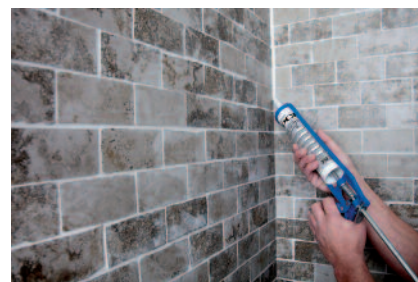
Durch den Einsatz von PCI Carraferm entstehen keine Randzonenverfärbungen bei Naturwerksteinen.