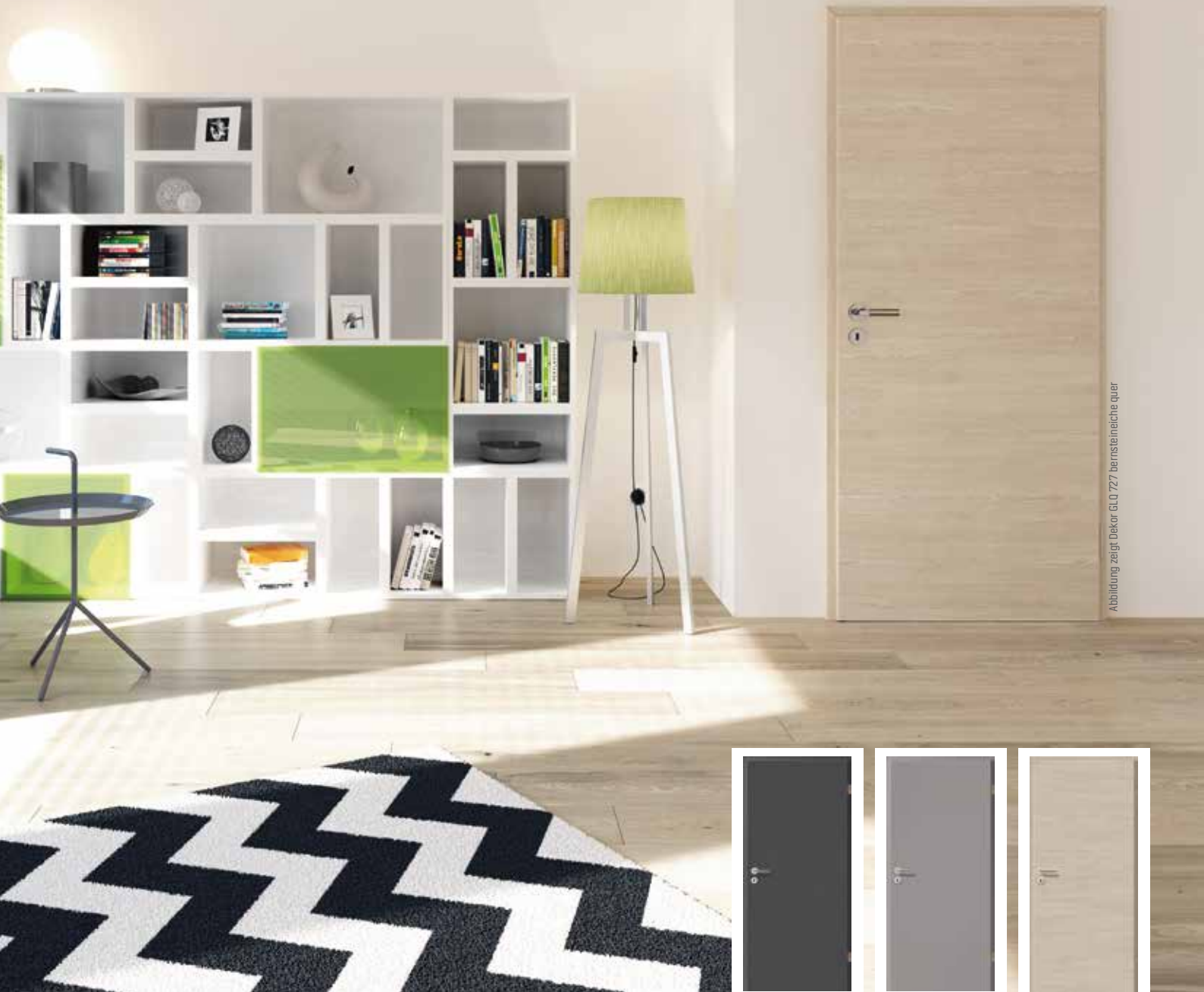
Abbildung zeigt Dekor GLO 727 bernsteinalche quer