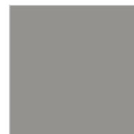
GL446 kitt hellgrau