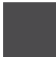
GL411 achat grau