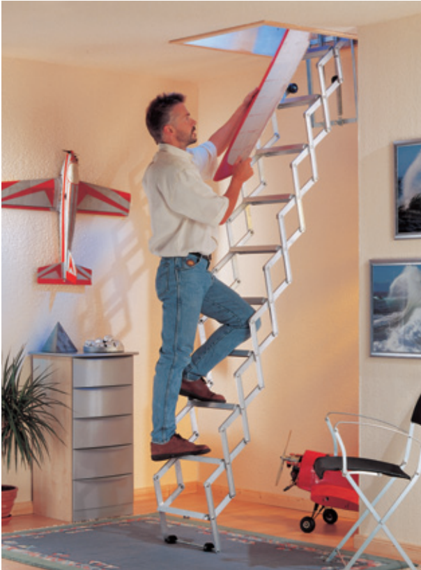
DOLLE alu-fix mit Stirnbrett