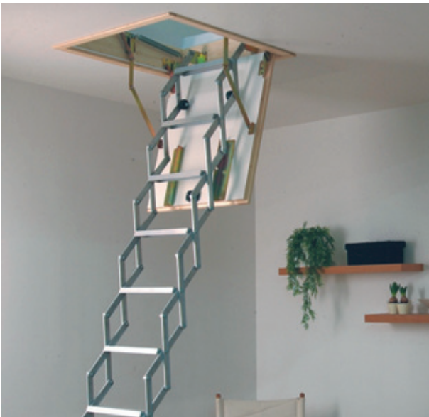
DOLLE alu-fix mit Lukenkasten